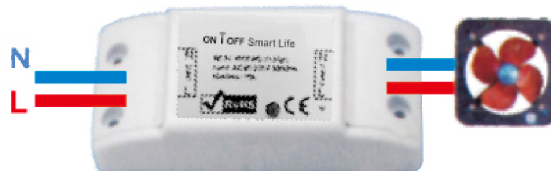
Instructions de câblage de la lampe de cellule