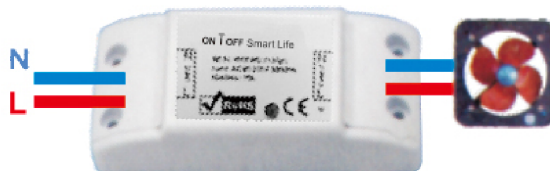
Lemputės prijungimo instrukcija