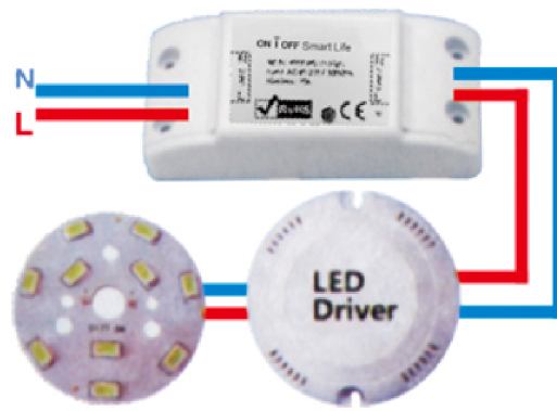
Návod na zapojenie jedného drôtu